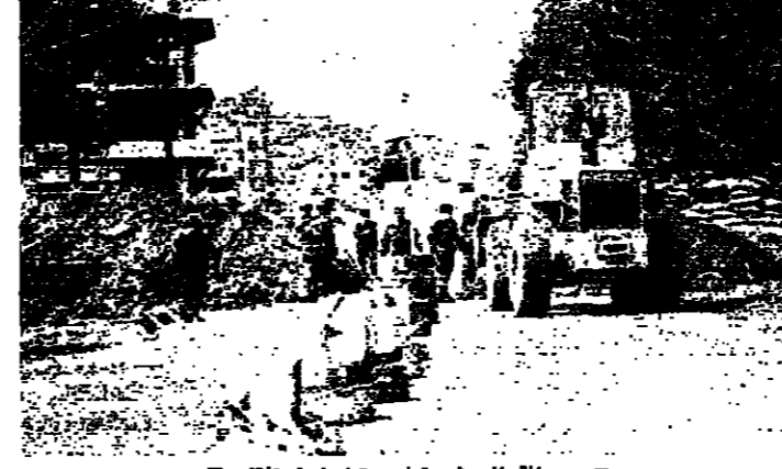
جرفاء الجيش ترفع مراسمات في زفتا

بينما يسعون للسيارات الخارجة لتوسيع عمليات الخروج من منطقة الجنوب لإفراجها من السكان. من جهته الجيش اللبناني، واصل امس عمليات تدعيم مواقفه للقمعة في البازورية وكوربة السيد والزراوية، وشوهت جرافات تعمل على تدعيم هذه المواقع ورفع السواتر الترابية حولها.